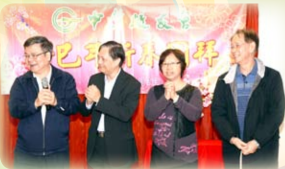
理事長向大家拜年

中業校友會舉辦癸巳年新春團拜，3月2日中午在會所聚會。各校友精神爽利，服裝鮮艷，一片新春景象，有百名校友到會，氣氛熱鬧。各位理事、校友互相祝賀，互相問候之聲不絕，歡聲笑語，洋溢會場，最多聽到的一句話是身體健康，是最好的祝福。