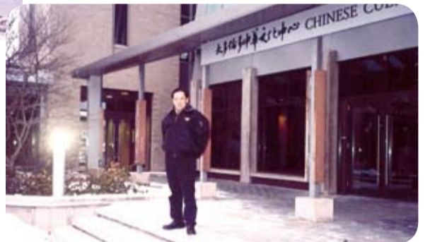
2005年3月攝於加拿大多倫多中華文化中心